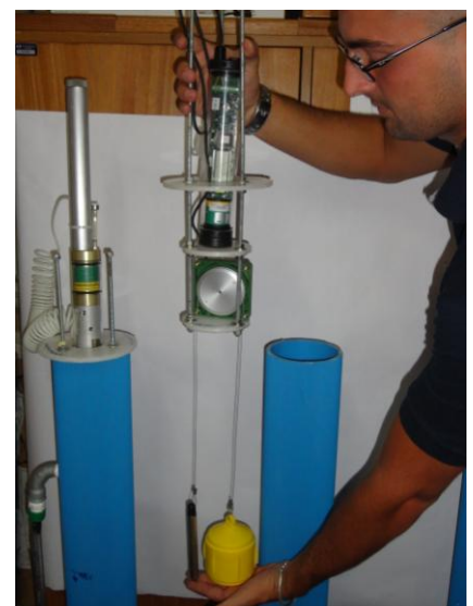
Foto 3 - Aparelho Thalimedes.