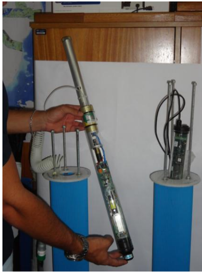
Fotos 2- Aparelho Orphimedes