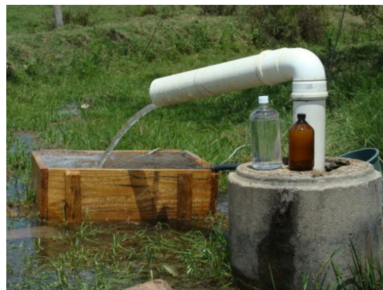
Figura 1 – Surgências na região do estudo.