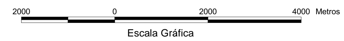
MAPA DE PONTOS D'ÁGUA 2003

O Projeto Cadastro de Fontes de Abastecimento por Água Subterrânea, no estado do Piauí é executado pela CPRM - Serviço Geológico do Brasil, sob a coordenação da Divisão de Hidrogeologia e Exploração - DIHEXP do Departamento de Hidrologia - DEHID/RJ.