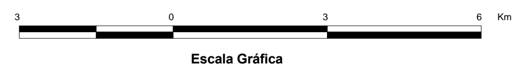
MAPA DE PONTOS D'ÁGUA 2003