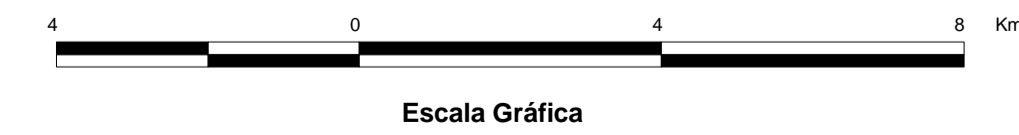
MAPA DE PONTOS D'ÁGUA 2003