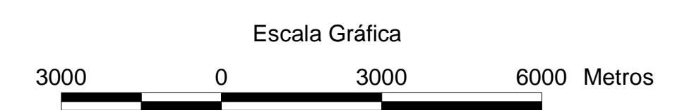
MAPA DE PONTOS D'ÁGUA 2003