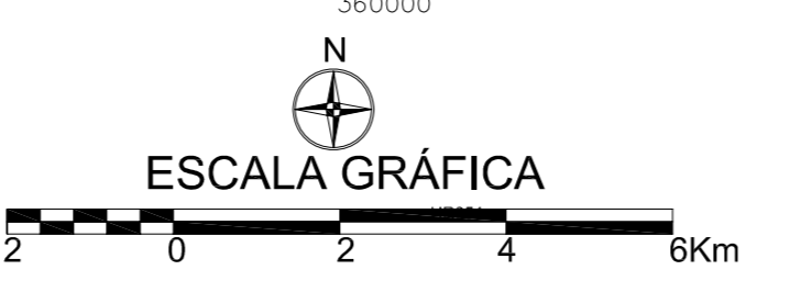
MAPA DE PONTOS D'ÁGUA 2005