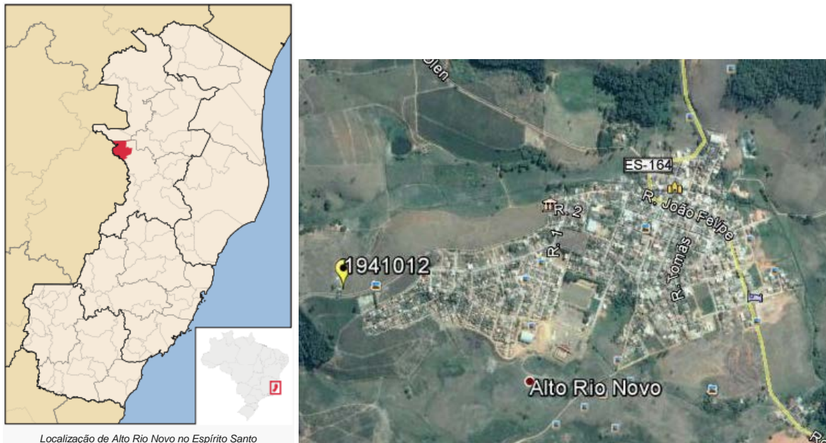
Figura 01 – Localização do Município e da Estação Pluviométrica.

A Estação Alto Rio Novo, Código ANA 01941012, está localizada na Latitude 19°03'33"S e Longitude 41°01'39"W (segundo o inventário da ANA), no município de Alto Rio Novo/ES. Esta estação pluviométrica é de responsabilidade da ANA e operada pela CPRM. Os dados para definição da equação IDF foram obtidos a partir dos dados diários de precipitação. A Figura 01 apresenta a localização do município e da estação.