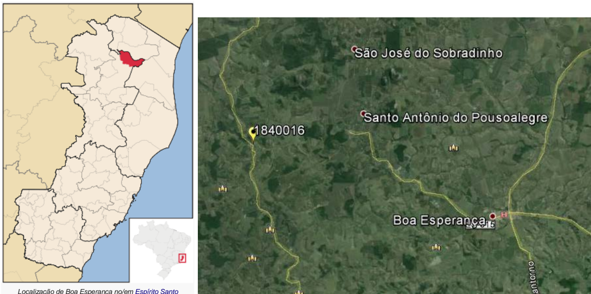
Figura 01 – Localização do Município e da Estação Pluviométrica.

A Estação Patrimônio VX, Código ANA 01840016, está localizada na Latitude 18°29'39"S e Longitude 40°27'51"W (segundo o inventário da ANA), no município de Nova Venécia/ES. Esta estação pluviométrica é de responsabilidade da ANA e operação pela CPRM. Os dados para definição da equação IDF foram obtidos a partir dos dados diários de precipitação. A Figura 01 apresenta a localização do município e da estação.