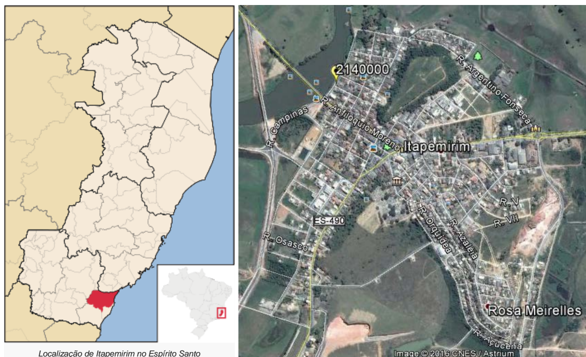
Figura 01 – Localização do Município e da Estação Pluviométrica.

A Estação Barra do Itapemirim (DNOS), Código ANA 02140000, está localizada na Latitude 21°00'27,00"S e Longitude 40°50'07,08"W (segundo o inventário da ANA), no município de Itapemirim/ES. Esta estação pluviométrica é de responsabilidade da ANA e operação pela CPRM. Os dados para definição da equação IDF foram obtidos a partir dos dados diários de precipitação. A Figura 01 apresenta a localização do município e da estação.