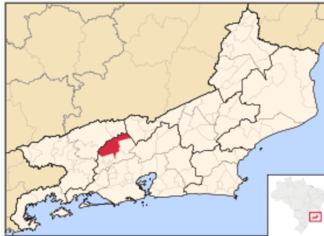
Localização de Vassouras no Rio de Janeiro

A Estação Barra do Piraí, Código ANA 02243002, está localizada na Latitude 22°27'02,16''S e Longitude 43°47'52,08''W (segundo inventário da ANA), no município de Barra do Piraí/RJ. Esta estação pluviométrica é de responsabilidade da ANA e operação pela CPRM. Os dados para definição da equação IDF foram obtidos a partir dos dados diários de precipitação. A Figura 01 apresenta a localização do município e da estação.