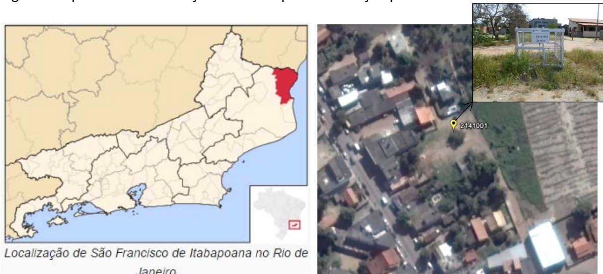
Figura 01 – Localização do Município e da Estação Pluviométrica.

A estação São Francisco de Paula – Cacimbas, código 02141001, está localizada na Latitude 21°28'58"S e Longitude 41°06'12"W. Os dados para definição da equação IDF foram obtidos a partir dos dados diários de precipitação coletados em pluviômetro convencional. A Figura 01 apresenta a localização do município e da estação pluviométrica.