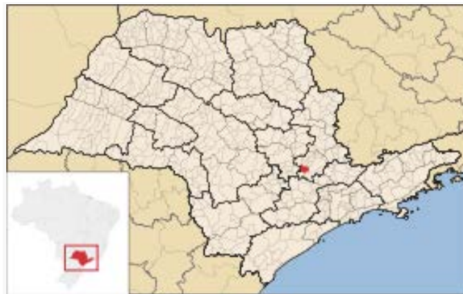
Localização de Monte Mor em São Paulo

A Estação Monte Mor, Código ANA 02247058, está localizada na Latitude 22°57'32"S e Longitude 47°17'46"W (segundo o inventário da ANA), no município de Monte Mor/SP. Esta estação pluviométrica é de responsabilidade da ANA e operada pela CONSTRUFAM. Os dados para definição da equação IDF foram obtidos a partir dos dados diários de precipitação. A Figura 01 apresenta a localização do município e da estação.