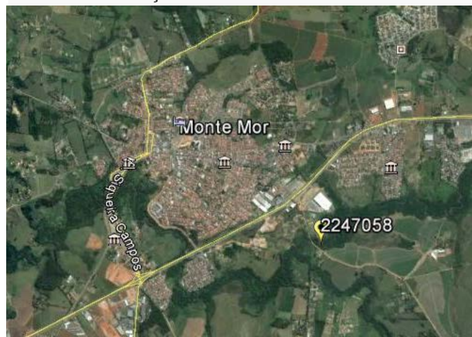
Figura 01 – Localização do Município e da Estação Pluviométrica.