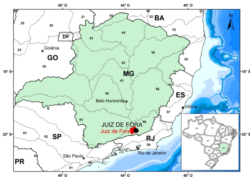
Figura 01 – Localização do Município e da Estação Pluviográfica.

A Figura 01 apresenta a localização do município e da estação.