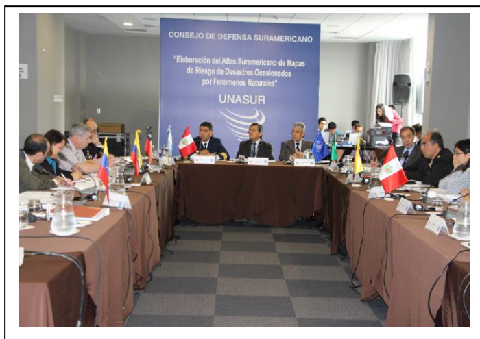
Foto 4 – Relato do andamento dos trabalhos pelas delegações na III RT