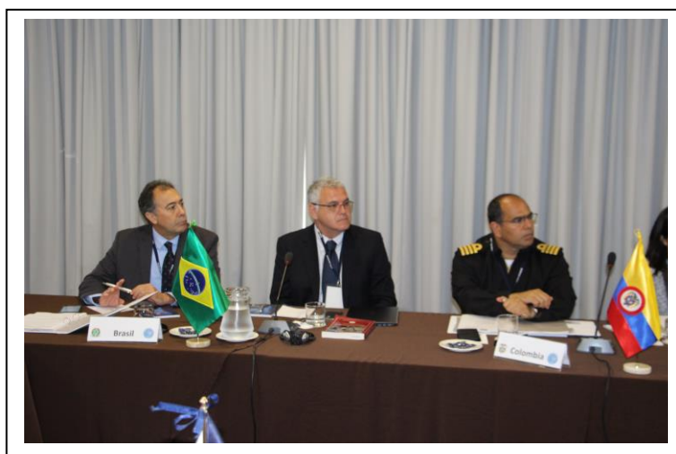
Foto 3 – Delegação brasileira na III Reunião Técnica do CDS UNASUL