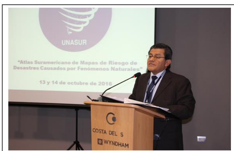
Foto 2 – Abertura dos trabalhos pelo Sr. Ministro de Defesa Mariano Gonzalez Fernandez.