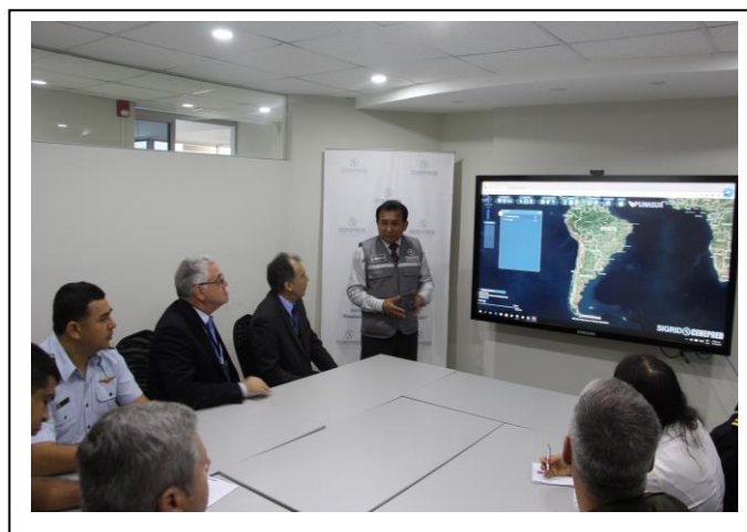
Foto 6 – Apresentação do SIGRID com a visualização dos dados de riscos geológicos dos municípios trabalhados pela CPRM e disponibilizados no sistema SID desenvolvido pela DIGEOP (DRI) e DEGET (DHT)