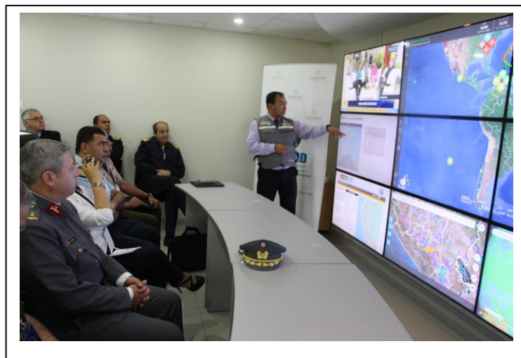
Foto 7 – Apresentação do sistema integrado de dados para a gestão de desastres do CENEPRED