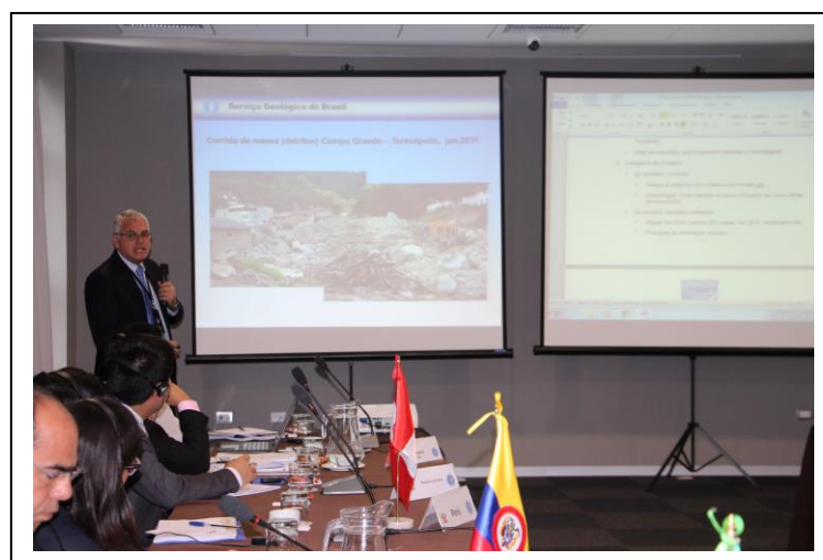
Foto 9 – Apresentação da CPRM sobre os tipos de processos de movimentos de massa que ocorrem no Brasil