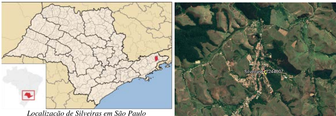
Localização de Silveiras em São Paulo

A localização do município e da estação de Silveiras é apresentada na Figura 01.