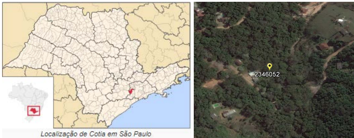
Figura 01 – Localização do Município e da Estação Pluviométrica.

A Estação Cachoeira da Graça, códigos 02346052 (ANA) e E3-034R (DAEE), está localizada na Latitude 23°39'00"S e Longitude 46°57'00"W. Esta estação pluviométrica continua em atividade, sendo operada pelo Departamento de Águas e Energia Elétrica do Estado de São Paulo (DAEE). Os dados para definição da equação IDF foram obtidos a partir dos dados diários de precipitação coletados em pluviômetro, no período de 1936 a 2014. A Figura 01 apresenta a localização do município e da estação.