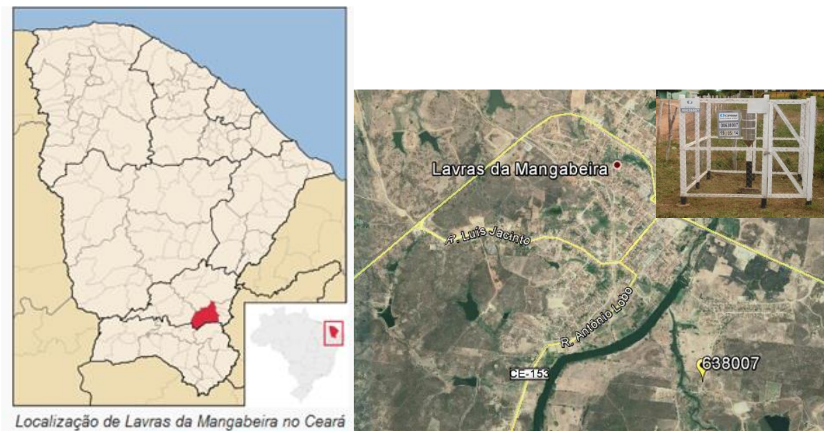
Figura 01 – Localização do Município e da Estação Pluviométrica.

A Estação Lavras da Mangabeira, Código ANA 00638007, está localizada na Latitude 6°45'46,42"S e Longitude 38°57'38.35"W, no próprio município de Lavras da Mangabeira/CE. Esta estação pluviométrica é de responsabilidade da ANA e operação da CPRM. Os dados para definição da equação IDF foram obtidos a partir dos dados diários de precipitação. A Figura 01 apresenta a localização do município e da estação.