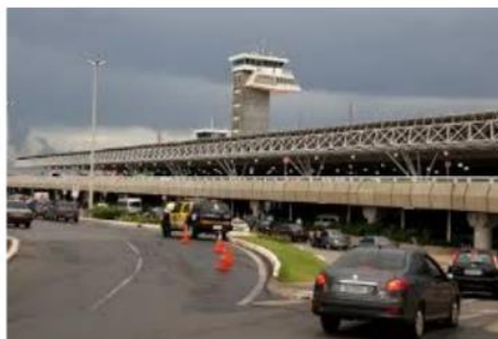
Aeroporto Internacional de Brasília

HORÁRIOS Check-in: 21:00 (09SET-Sexta) Decolagem: 00:30 (10SET-Sábado)