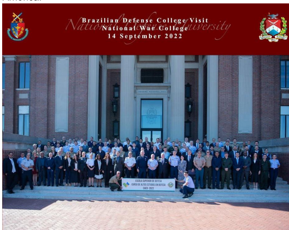
Visita ao Colégio Interamericano de Defesa

Em complemento houveram visitas ao National War College e ao Colégio Interamericano de Defesa, onde a partir de palestras diversas, incluindo o embaixador do Brasil nos EUA, Nestor Forster Junior e adidos militares brasileiros, que trouxeram ampla visão da relação entre Brasil, EUA e demais estados americanos, no que tange a ações conjuntas em prol da defesa do continente, dentro do contexto geopolítico que engloba todas as nações da América.