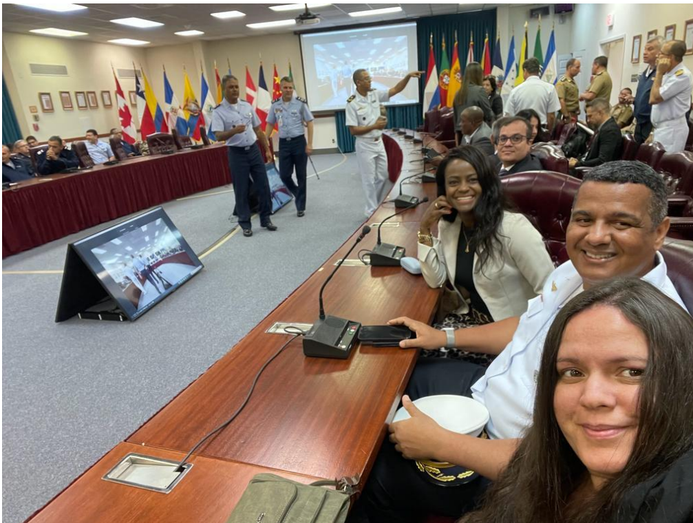
Visita à Junta Interamericana de Defesa.