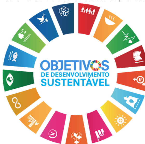
Figura 1 - Objetivos de desenvolvimento sustentável.

Ressalta-se ainda que este estudo está em consonância com os Objetivos do Desenvolvimento Sustentável 2 (Figura 1) e com o marco pós-2015 para a redução de riscos de desastres, também conhecido como Marco de Sendai 3 .