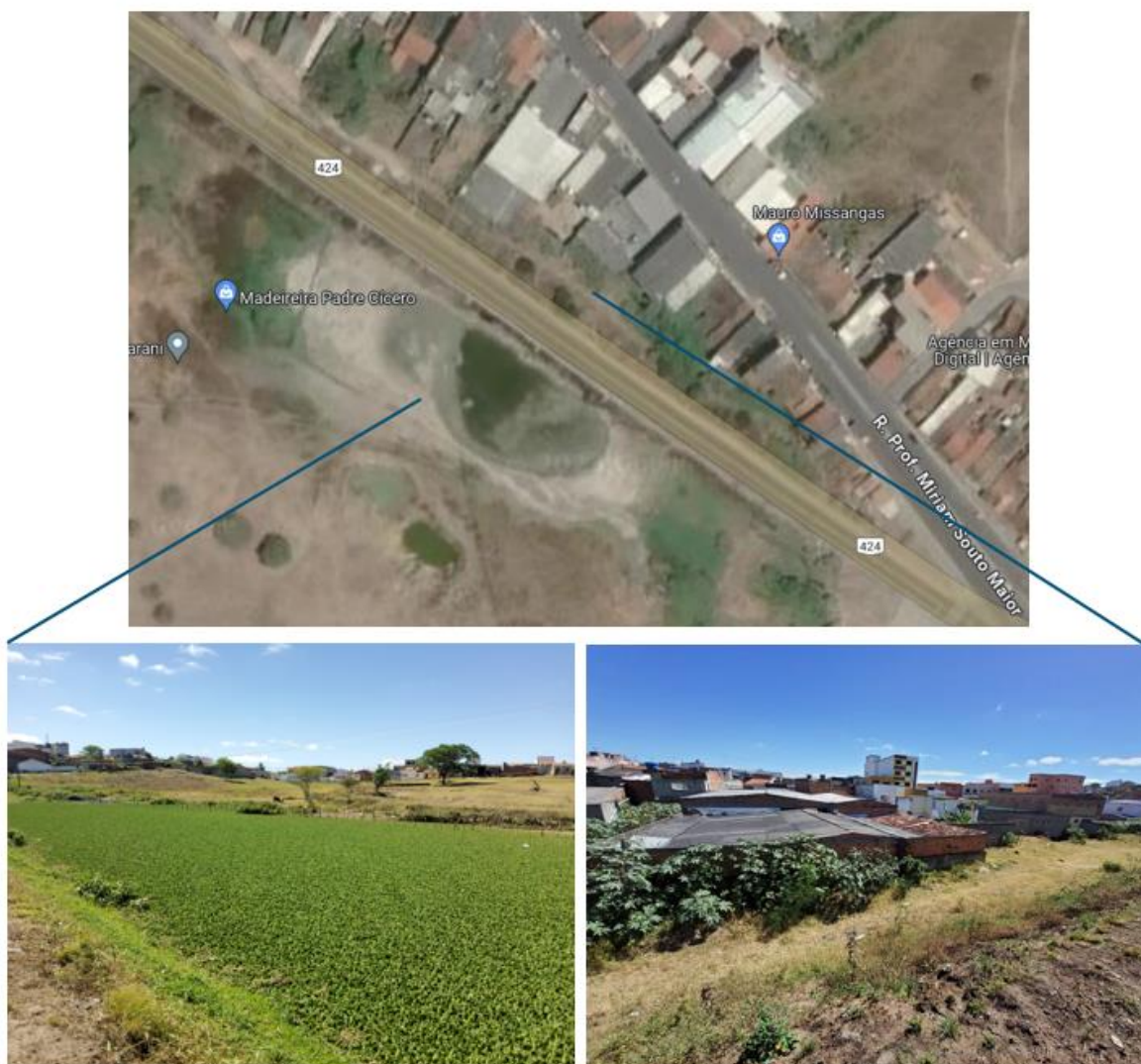
Figura 3 – Imagem google e fotos da área alagada possivelmente por obstrução, inexistência ou mal dimensionamento dos drenos sob a rodovia

Segundo informações da Defesa Civil, a recorrência deste evento no local é a cada 5 ou 6 anos, e quando ocorrem atingem 3 ou 4 propriedades. Ainda segundo a Defesa Civil, apesar de não ter havido, até o momento, grandes danos, a situação tem preocupado a administração pública e moradores do local.