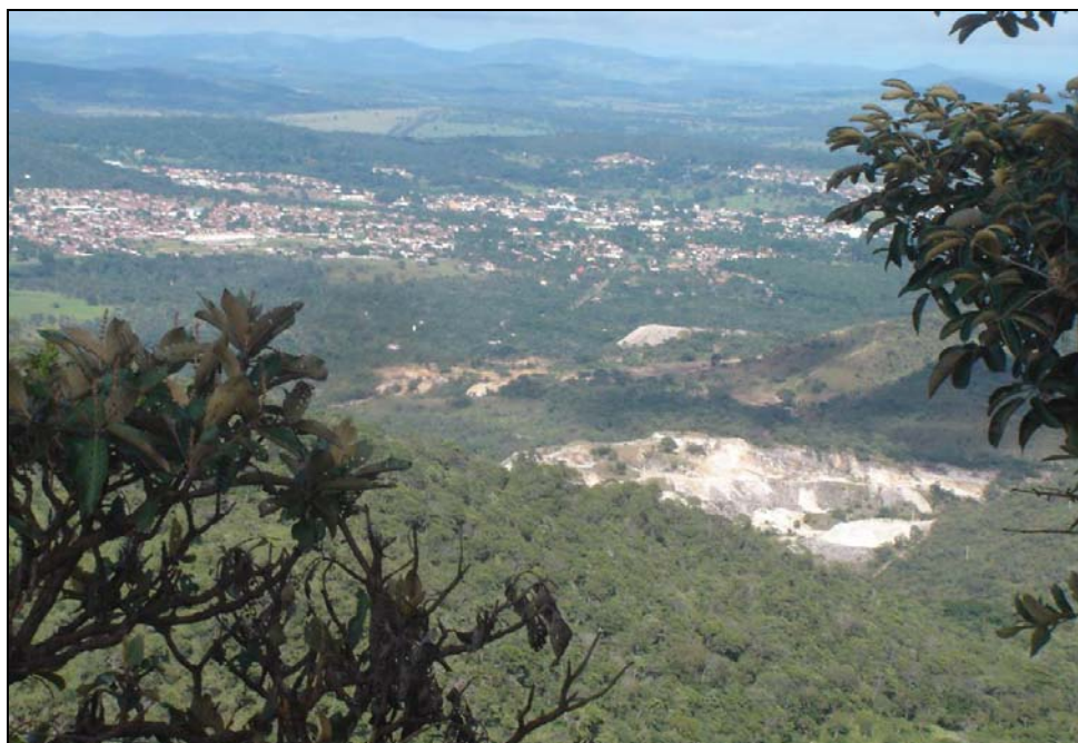
Figura 3 – Foto da degradação paisagística promovida pela lavra de Quartzito em Pirenópolis-GO.

De todos os impactos, os de maior grau, conforme observado em campo, são aqueles relacionados à fase de lavra, incluindo a disposição do rejeito e a conseqüente degradação paisagística. A lavra do quartzito deixa marcas que, mesmo de longe, chamam a atenção pela degradação da paisagem, conforme pode ser observado na Figura 3.