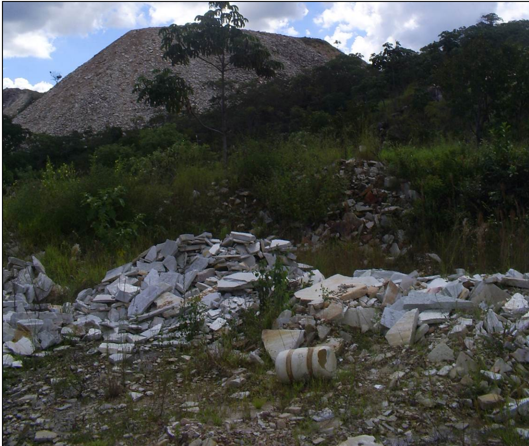
Figura. 4 – Foto das Pilhas de Rejeitos (no primeiro plano e ao fundo) na Pedreira da Prefeitura.

Quanto ao rejeito, Barros (2002a), através de levantamento topográfico, avaliou 70 pilhas de rejeito em áreas da Pedreira da Prefeitura, por meio do dimensionamento de cada pilha. A realização do processo permitiu-lhe estimar um universo de 748.020 m 3 de rejeitos. (Figura 4)