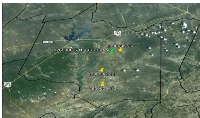
Figura 1 – Representação espacial de captações subterrâneas do município de Ibimirim - Sertão de Pernambuco, pesquisadas através do Visual Poços Pro e SIAGAS WEB, plotados no Google Earth.

As informações podem ser representadas espacialmente e, assim, se verificar as primeiras condições relacionadas à disponibilidade de uma região (Figura 1).