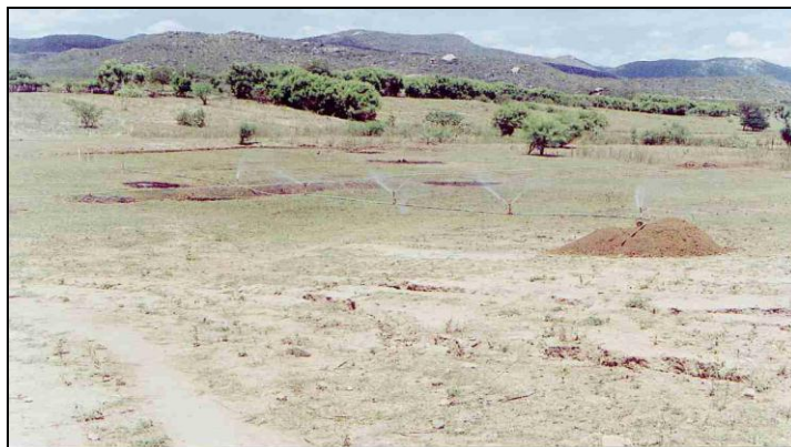
Figura 4 - Irrigação por aspersão realizada a partir do poço da barragem subterrânea – Distrito de Mutuca – Pesqueira/PE.

Conhecendo-se a situação geral das condições das captações subterrâneas através do SIAGAS, é possível planejar a possibilidade do incremento do uso das barragens para determinadas regiões (Figura 4).