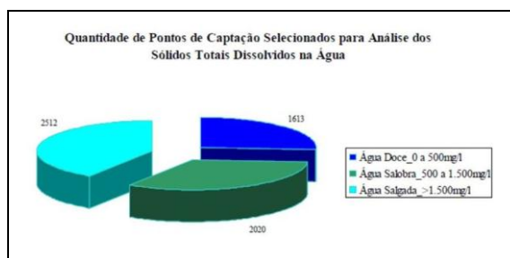
Figura 3 – Quantidade de pontos de captação para análise dos sólidos totais dissolvidos na água nos municípios das regiões agreste e sertão de Pernambuco.

Trabalhando com as mesmas localidades, é possível ainda, segundo COSTA (2009), obter informações referentes a análise dos sólidos totais dissolvidos nas regiões (Figura 3).