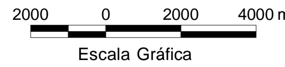
MAPA DE PONTOS D'ÁGUA 2003

O Projeto Cadastro de Fontes de Abastecimento por Água Subterrânea no Estado do Piauí é executado pela CPRM - Serviço Geológico do Brasil, sob a coordenação da Divisão de Hidrogeologia e Exploração - DIHEXP do Departamento de Hidrologia - DEHID/RJ.