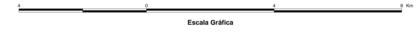
MAPA DE PONTOS D'ÁGUA 2003