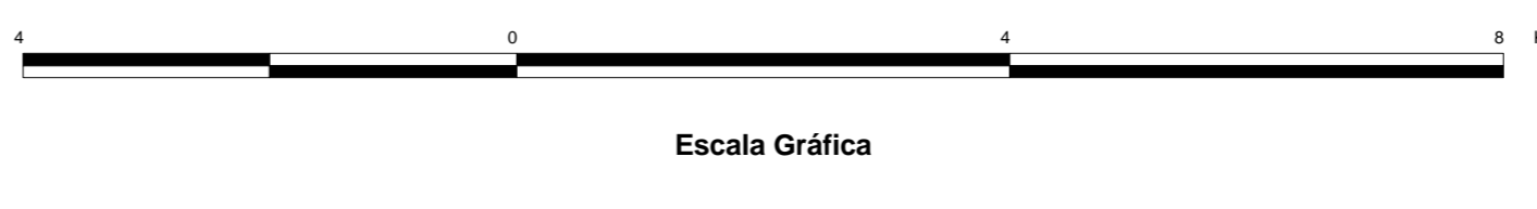
MAPA DE PONTOS D'ÁGUA 2003