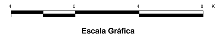
MAPA DE PONTOS D'ÁGUA 2003