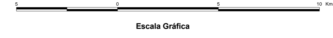
MAPA DE PONTOS D'ÁGUA 2003