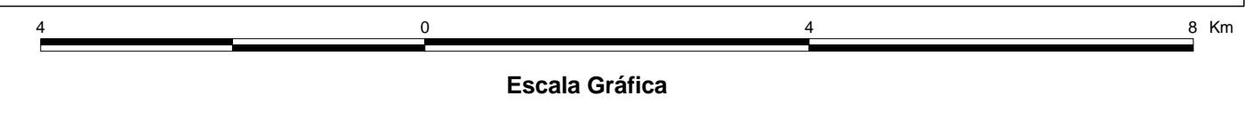
MAPA DE PONTOS D'ÁGUA 2003