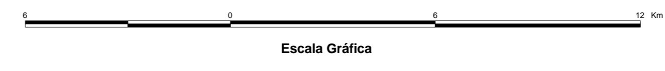
MAPA DE PONTOS D'ÁGUA 2003