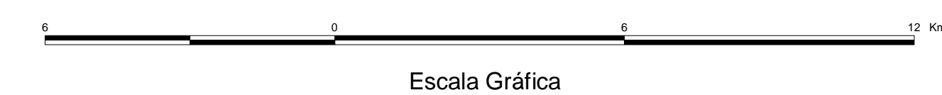
MAPA DE PONTOS D'ÁGUA 2003