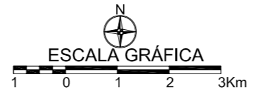
MAPA DE PONTOS D'ÁGUA 2005