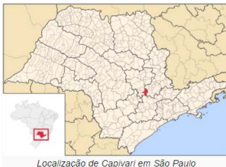
Figura 01 – Localização do Município (Fontes: Wikipédia e Google, 2016)

A estação Capivari, códigos 02247110 (ANA) e D4-069 (DAEE), está localizada na Latitude 22°59'59"S e Longitude 47°30'00"W. Esta estação pluviométrica encontra-se em atividade desde 1946, sendo operada pela FCTH/DAEE-SP. Os dados para definição da equação IDF foram obtidos a partir dos dados diários de precipitação coletados em pluviômetro, no período de 1946 a 2014. A Figura 01 apresenta a localização do município.