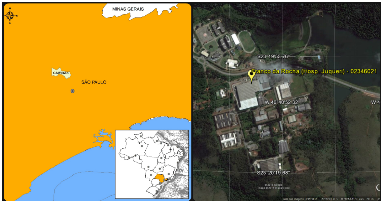
Figura 01 – Localização do Município e da Estação Pluviográfica

A estação de Franco da Rocha – Hosp. Juqueri, código ANA 02346021/ DAEE E3-047, está localizada na Latitude 23°19'59.88" S e Longitude 46°40'59.88" W, acesso pela Estr. do Governo, Rodovia SP-023, que liga Franco da Rocha a Mairiporã. Os dados para definição da equação IDF foram obtidos no Banco de Dados Pluviográficos do Estado de São Paulo, a partir do site do Departamento de Águas e Energia Elétrica - DAEE. A Figura 01 apresenta a localização do município e da estação.