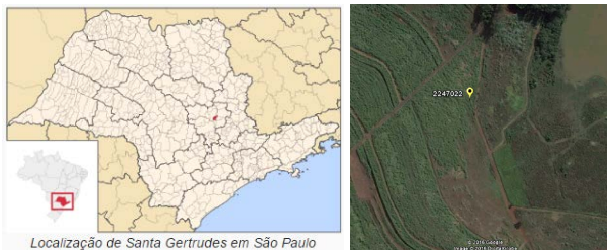
Figura 01 – Localização do Município e da Estação Pluviométrica. (Fontes: Wikipédia e Google, 2016)

A estação Santa Gertrudes, códigos 02247022 (ANA) e D4-059 (DAEE), está localizada na Latitude 22°29'00"S e Longitude 47°31'00"W. Esta estação pluviométrica encontra-se em atividade desde 1941, sendo operada pela FCTH/DAEE-SP. Os dados para definição da equação IDF foram obtidos a partir dos dados diários de precipitação coletados em pluviômetro, no período de 1941 a 2010. A Figura 01 apresenta a localização do município e da estação pluviométrica.