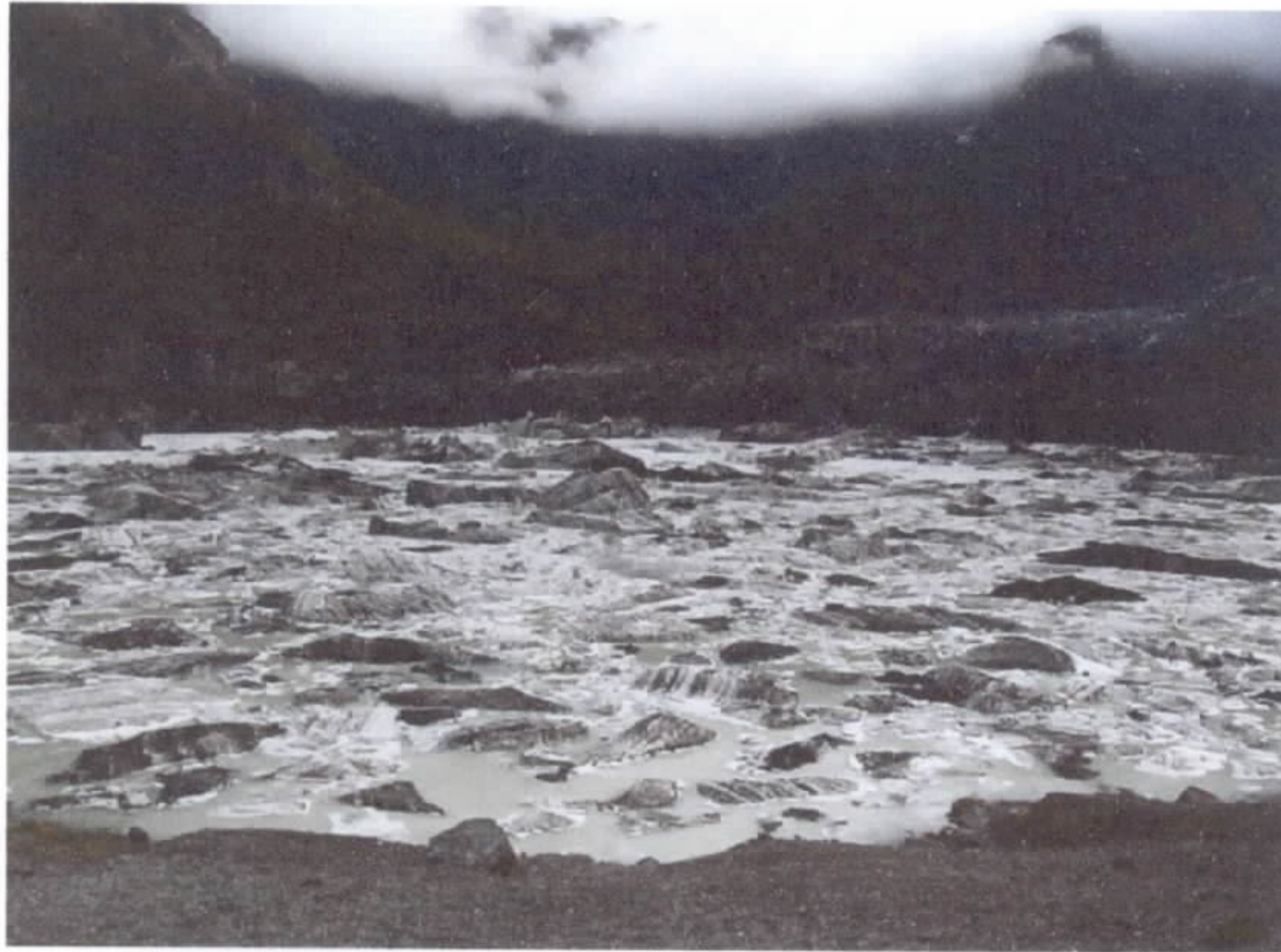
Fig. 3 – Imagem da geleira Ventisquero Negro.