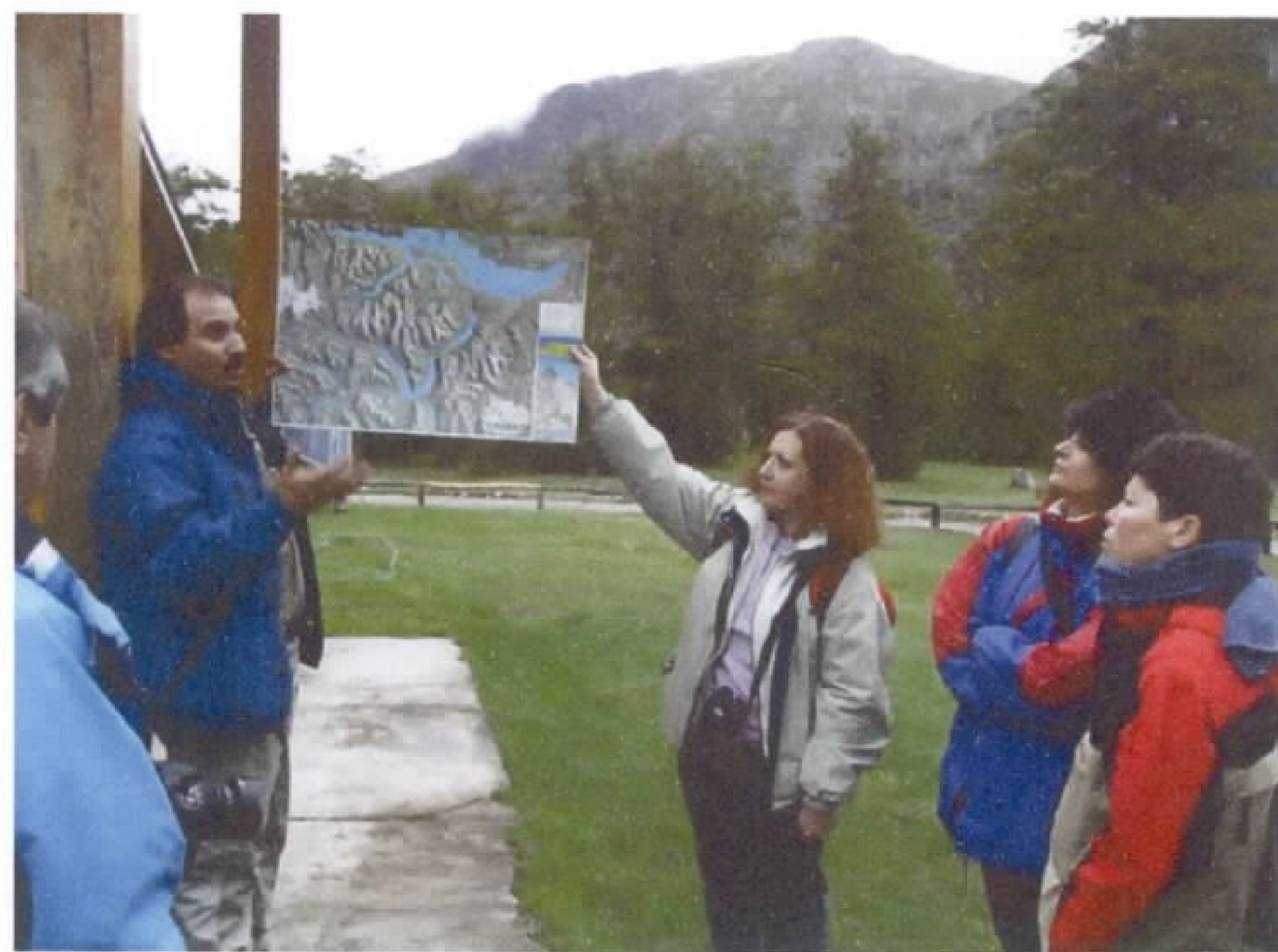
Fig. 2 – Explicação por parte dos organizadores da excursão geológica.