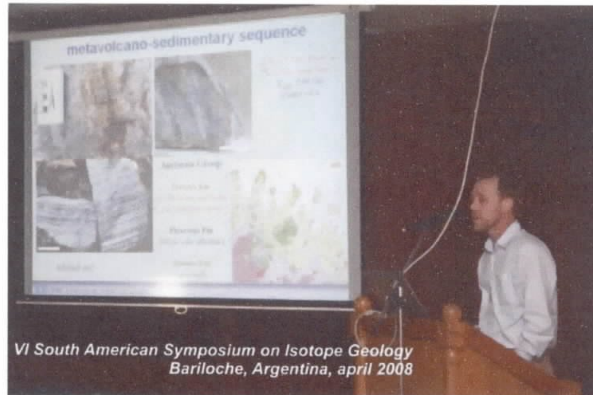
Fig. 1 – Momento da palestra proferida pelo autor.