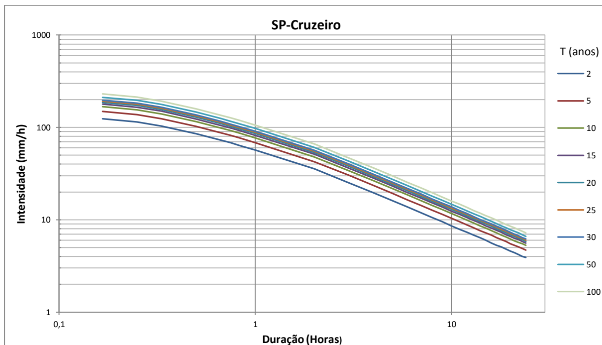
Figura 02 – Curvas intensidade-duração-frequência

A Figura 02 apresenta as curvas ajustadas.