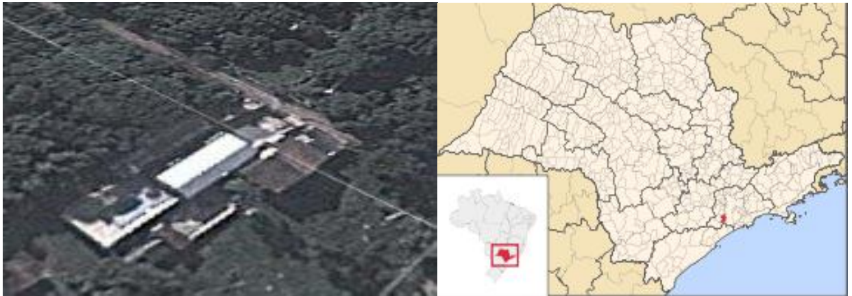
Figura 01 – Estação Pluviográfica e Localização do Município. (Fontes: Google Earth, 2013 e Wikipédia, 2013)

A Estação Mombaca, código 02346070 (E3-068), está localizada na Latitude 23°46'00"S e Longitude 46°50'00"W, no vizinho município de Itapecerica da Serra, na região periférica. Esta estação pluviográfica continua em atividade, sendo operada por FCTH / DAEE - SP. Os dados para definição da equação IDF foram obtidos a partir dos pluviogramas de um pluviógrafo IH. A Figura 01 apresenta a localização do município e da estação.