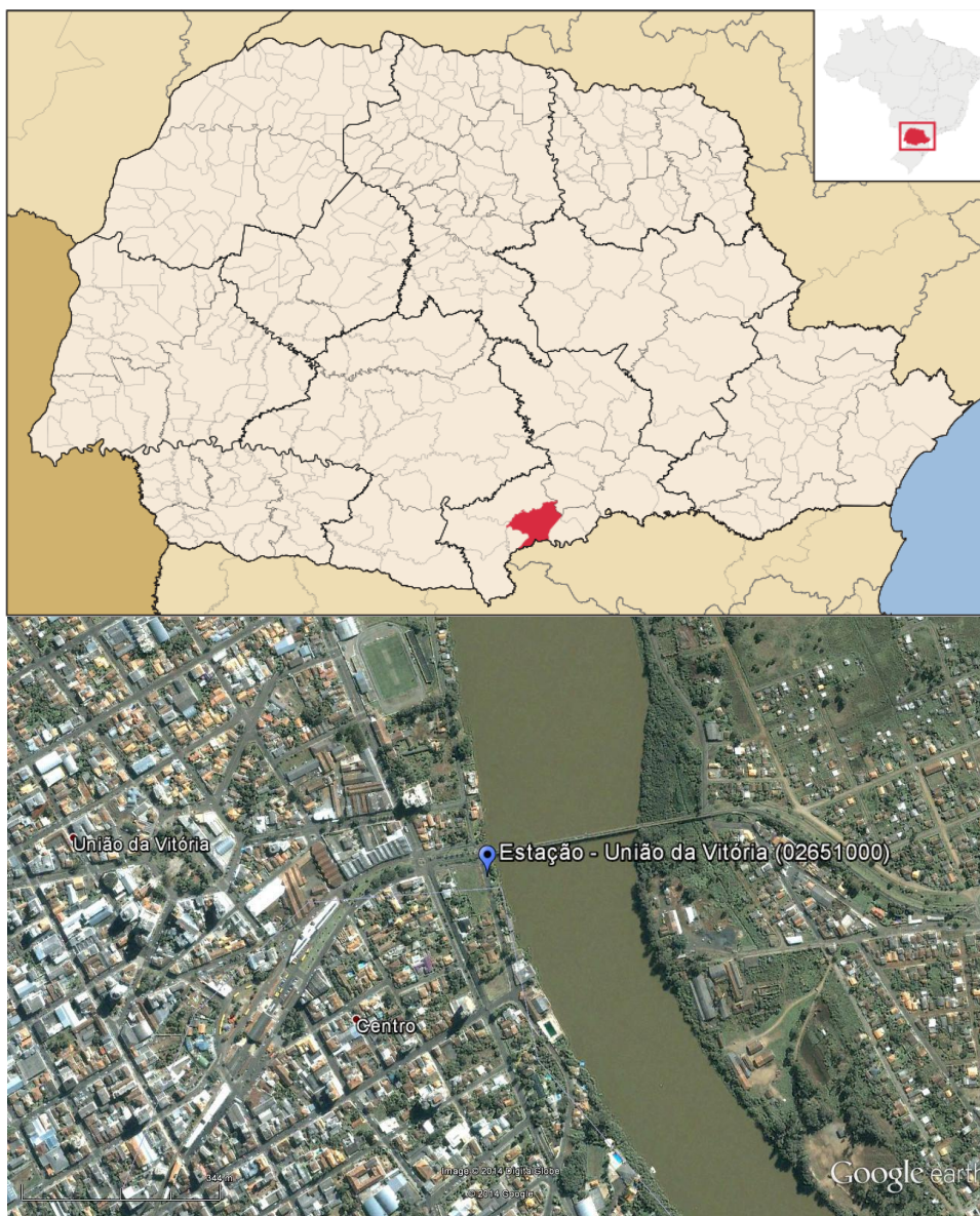
Figura 01 – Localização do Município e da Estação Pluviométrica.

A estação de União da Vitória, código 02651000, está localizada na Latitude 26^{\circ}13'41'' S e Longitude 51^{\circ}4'49'' WGr, em União da Vitória/PR, sob responsabilidade da COPEL e operação da AGUASPARANÁ. A Figura 01 apresenta a localização do município e da estação.