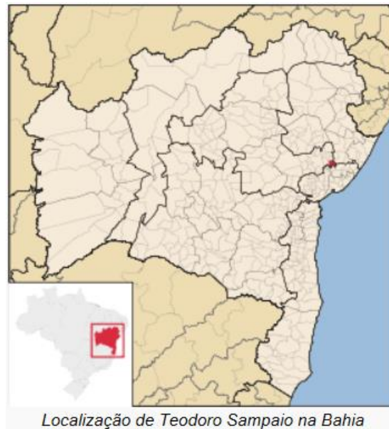
Figura 01 – Localização do Município

A estação de Teodoro Sampaio, código 01238051, fica localizada na Latitude 12^{\circ}18'13'' S e Longitude 38^{\circ}38'21'' W, na Rua da Matriz, próximo a Igreja, no município de Teodoro Sampaio, e se encontra em operação. Os dados para definição da equação IDF foram obtidos a partir dos pluviogramas de um pluviógrafo marca HIDROMECC. A Figura 01 apresenta a localização do município.