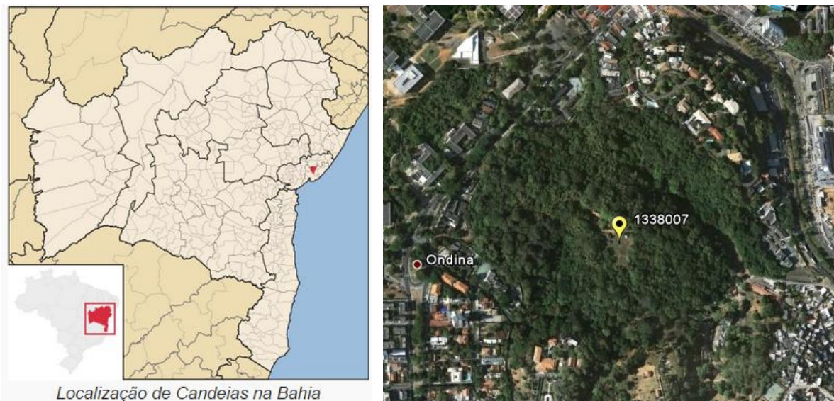
Figura 01 – Localização do Município e da Estação Pluviométrica.

A estação Salvador - Ondina, códigos 01338007 (ANA); 83229 (INMET), está localizada na Latitude 13°01'00"S e Longitude 38°53'00"W. Esta estação pluviométrica continua em atividade, sendo operada pelo Instituto Nacional de Meteorologia (INMET). Os dados para definição da equação IDF foram obtidos a partir dos dados diários de precipitação coletados em pluviômetro convencional. A Figura 01 apresenta a localização do município e da estação pluviométrica.