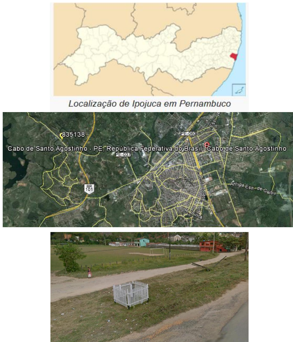
Figura 01 – Localização do Município e da Estação Pluviométrica.

A Estação Pirapama, Código ANA 00835138, está localizada na Latitude 8°16'47.42"S e Longitude 35°03'44.55"W (coletadas através de visualização na imagem do Google Earth, com o auxílio da ferramenta Street View), no município de Cabo de Santo Agostinho/PE. Esta estação pluviométrica é de responsabilidade da ANA e operação pela CPRM. Os dados para definição da equação IDF foram obtidos a partir dos dados diários de precipitação. A Figura 01 apresenta a localização do município e da estação.