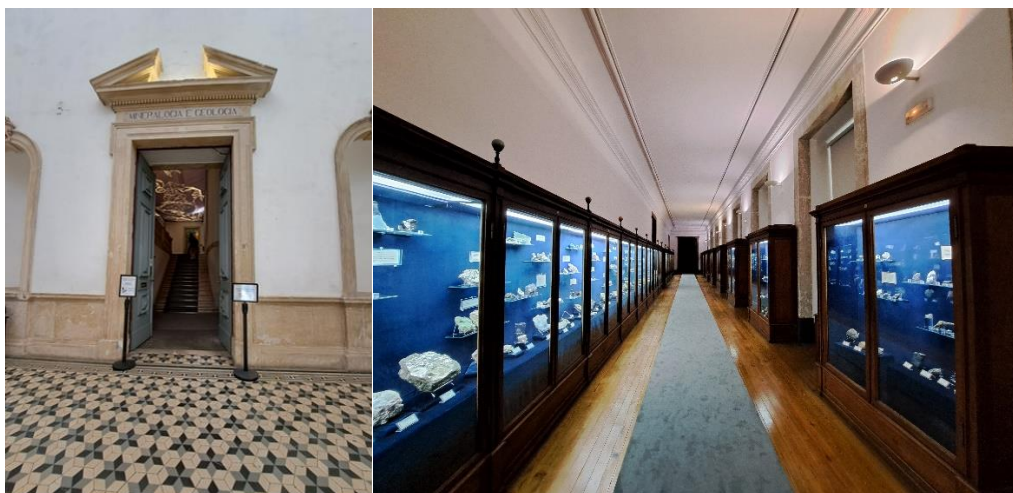
Figura 4 – Visita ao Museu de Ciência da Universidade de Coimbra – Setor de Mineralogia e Geologia – Roteiro 1.