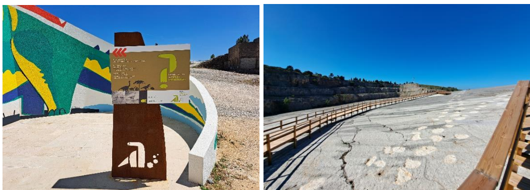
Figura 3 – Visita ao Centro de Interpretação de Vista à Jazida com Pegadas de Dinossauros – Pedreira do Galinha – Ourém Torres Novas