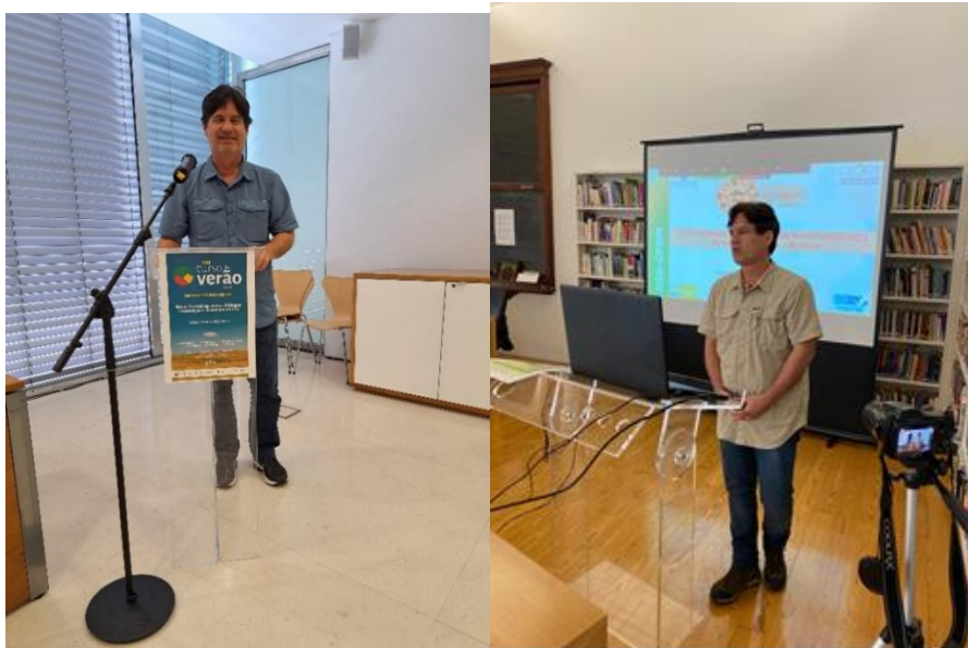
Figura 8 – Participação no curso de Verão na Guarda e palestrando no Dia Internacional da Geodiversidade em 06/10/22.