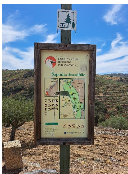
Figura 6 – Visita ao Parque Natural do Douro Internacional Sapinha - Escalhão - Roteiro 3.