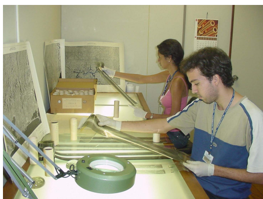
Figura 1 - Equipe técnica do Projeto RADAM-D selecionando os diafilmes e negativos.

van Roessel, J. W.; Godoy, R. C. SLAR Mosaics for Project RADAM. Photogrametric Engineering , v. 40, n. 5, p. 583-595, 1974.