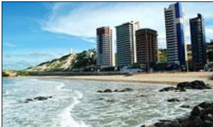
Engorda de praia em Conceição da Barra (ES).

Fonte: Nominuto.com. Notícias. Cidades. Prefeitura de Natal ganha ação sobre aterro hidráulico em Areia Preta. Disponível em: http://www.nominuto.com/noticias/cidades/prefeitura-de-natal-ganha-acao-sobre-aterro-hidraulico-em-areia-preta/18870/ .