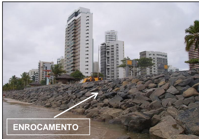
Enrocamento construído para proteger a orla da erosão na Praia de Boas Viagem, no Recife (PE).