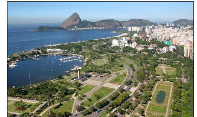
A foto da esquerda mostra a orla da baía de Guanabara em 1950, antes dos aterros; a da direita é recente e mostra o Parque Brigadeiro Eduardo Gomes, mais conhecido como Aterro do Flamengo, inaugurado em 1965.