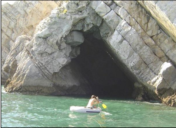
A Lapa da Boca do Tamboril, na região da Arrábida, em Portugal, é uma gruta esculpida no calcário pela ação da água do mar.

Os principais agentes da erosão marinha são as ondas e correntes. Entretanto, a água do mar também atua no processo erosivo, dissolvendo rochas como os calcários, podendo formar grutas marinhas.