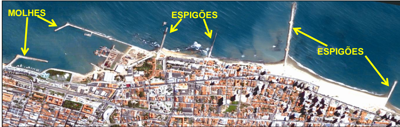
Obras de engenharia costeira construídas ao longo do litoral de Fortaleza (CE).

Fonte: BRANDÃO, R. de L. Regiões costeiras. In: SILVA, C. R. da. Geodiversidade do Brasil: conhecer o passado, para entender o presente e prever o futuro.